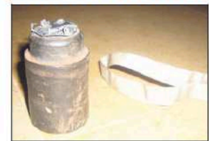
Cette sous-munition s'accroche dans les arbres et les buissons.